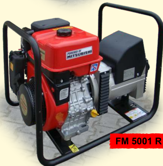
FM 5001 R

Wraz z zadymiarką „Casefog-1” proponujemy do wyboru dwa sprawdzone w praktyce jednofazowe agregaty prądowórcze firmy Akmel: model AP3001 oraz model FM 5001 R. Tworzą one kompleksowy system i zapewniają wydajne i stabilne działanie zadymiarki we wszystkich warunkach środowiska pracy.